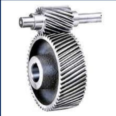
Spur and Helical Gears