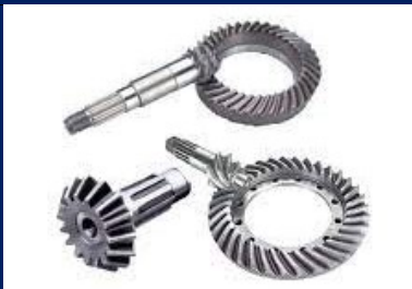
Bevel and Worm Gears