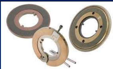
Clutches, Brakes, Couplings, and Flywheels