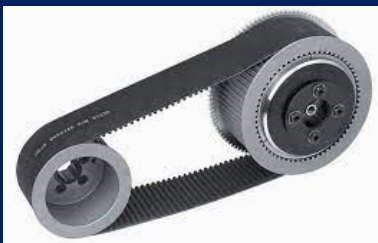
Flexible Mechanical Elements